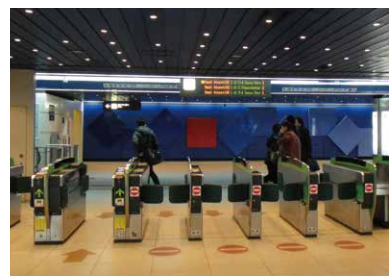
8 JR新千岁机场车站检票口 站台在地下2层。