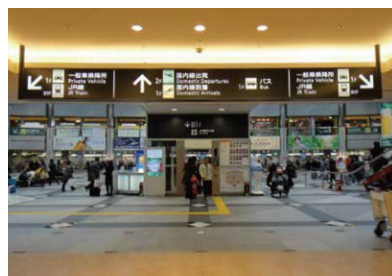
4 穿过小商店后可以看到国内线 航站楼的电梯。