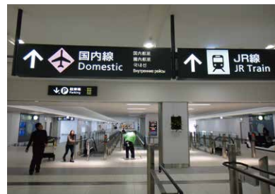
2 穿过约240米的连接通道前往 国内线航站楼。