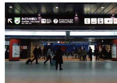
6 从地下1层下电梯后向右走， 可以看到JR外籍旅客服务处。