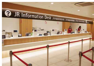
7 JR外籍旅客服务处 可兑换铁路周游券、购买JR 车票。