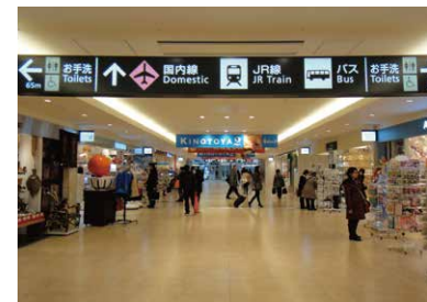
3 国内线航站楼 一直往前走。