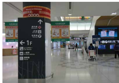
1 国际线航站楼 2层到达大厅。

从新千岁机场国际线候机楼前往札幌市内，使用铁路十分便利。 新千岁机场和札幌站之间运行的快速Airport号每隔15分钟就有一班，路程只需37分钟。 从国际线候机楼前往JR新千岁机场车站的道路指南信息如下。