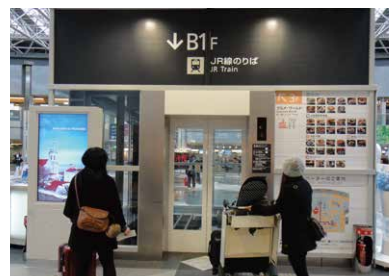
5 乘坐国内线航站楼的电梯前往 地下1层。