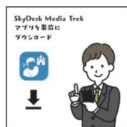
事先下载 SkyDesk Media Trek APP