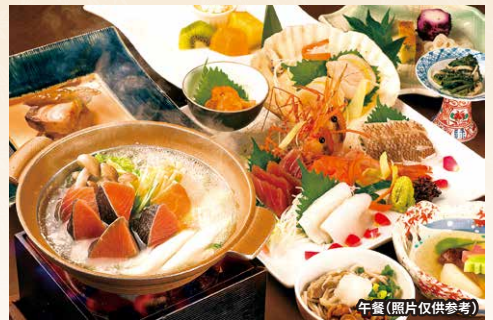
午餐 (照片仅供参考)