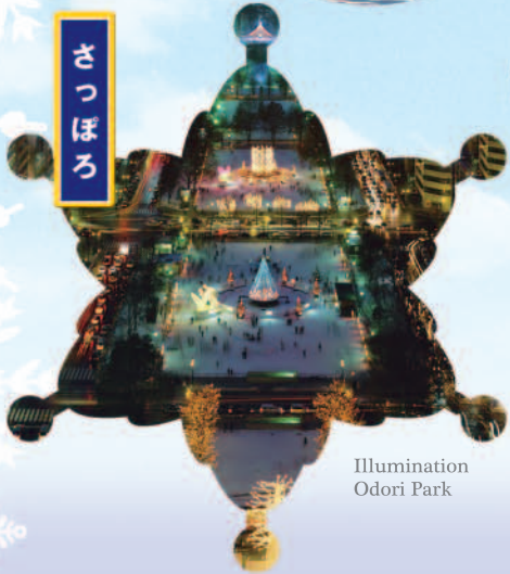
Illumination Odori Park