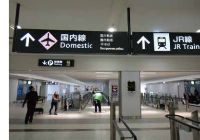
2 국내선 여객터미널까지 약 240m 길이의 연결통로를 따라 이동합니다.