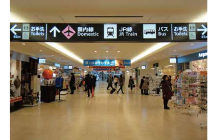
3 국내선 여객터미널 도착 후에는 상점가를 따라 직진합니다.