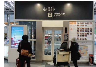
5 엘리베이터를 타고 지하 1층으로 내려갑니다.