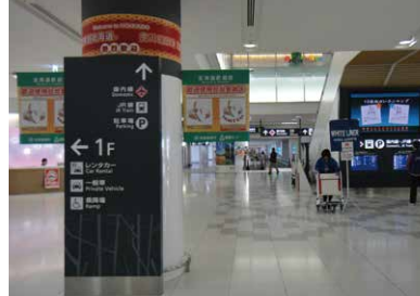
1 국제선 여객터미널 2층 도착로비 부터 출발합니다.

신치토세공항 국제선터미널에서 삿포로 시내까지 열차를 이용하시면 매우 편리합니다. 신치토세공항~삿포로역 사이에 쾌속 AIRPORT가 15분 간격으로 운행되고 있으며, 소요시간은 약 37분입니다. 국제선터미널에서 JR신치토세공항역까지 가시는 길은 아래를 참고하여 주시기 바랍니다.