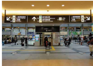
4 상점가를 지나면 국내선 여객터미널 엘리베이터가 있습니다.