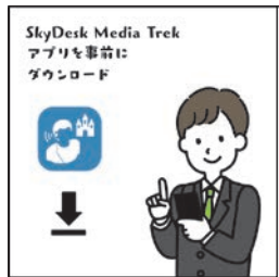
SkyDesk Media Trek APP 앱을 미리 다운로드