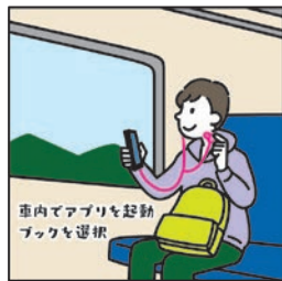
차에서 앱 실행 북 선택