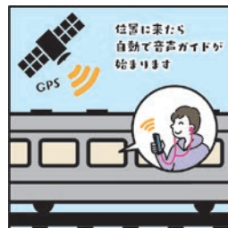
위치에 도착하면 자동으로 음성 안내를 시작합니다