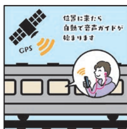
위치에 도착하면 자동으로 음성 안내를 시작합니다