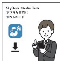
SkyDesk Media Trek APP 앱을 미리 다운로드