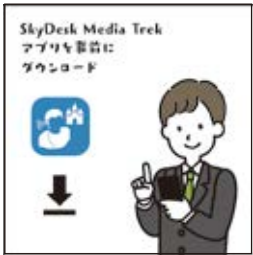
SkyDesk Media Trek APP 앱을 미리 다운로드