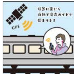
위치에 도착하면 자동으로 음성 안내를 시작합니다