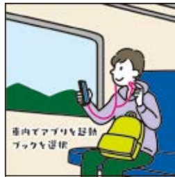
차에서 앱 실행 북 선택