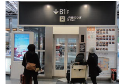
5 엘리베이터를 타고 지하 1층으로 내려갑니다.