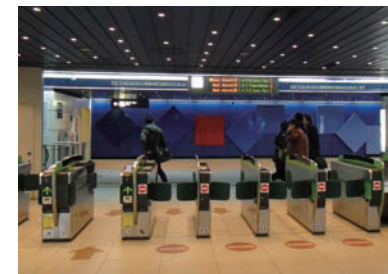
8 승차장은 JR신치토세공항역 지하 2층에 위치하고 있습니다.