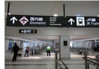
2 국내선 여객터미널까지 약 240m 길이의 연결통로를 따라 이동합니다.