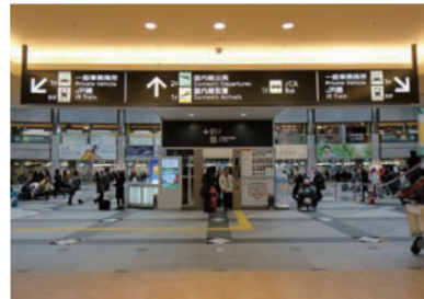
4 상점가를 지나면 국내선 여객터미널 엘리베이터가 있습니다.