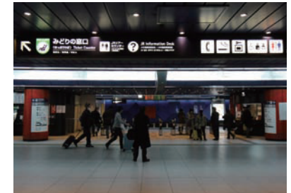
6 지하 1층 엘리베이터 왼쪽으로 JR인포메이션 데스크가 위치하고 있습니다.