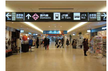
3 國內線航廈 一直往前走。