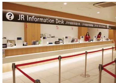
7 JR外籍旅客服務處 可兌換鐵路周遊券、購買JR 車票。