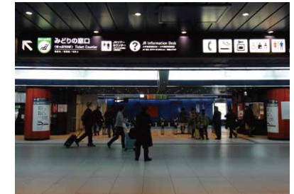
6 從地下1樓下電梯後向右走， 可以看到JR外籍旅客服務處。