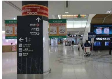
1 國際線航廈 2樓抵達大廳。

從新千歲機場國際線航廈前往札幌市內，使用鐵路十分便利。 新千歲機場和札幌站之間運行的快速Airport號每隔15分鐘就有一班，路程只需37分鐘。 從國際線航廈前往JR新千歲機場車站的動線導覽如下。