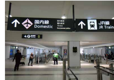
2 穿過約240公尺的連接通道前往國內線航廈。