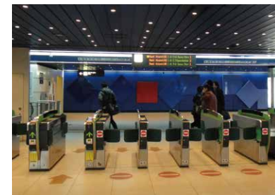
8 JR新千歲機場車站驗票閘門 月台在地下2樓。