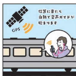
在接近設置的位置時， 語音導覽會自動開始播放。