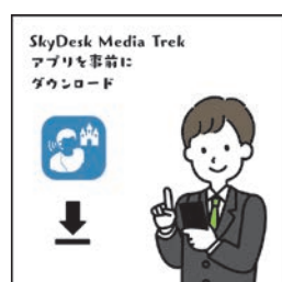
事先下載 SkyDesk Media Trek APP