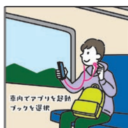
在車內打開 APP 選擇 Book