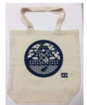
*禮品圖片僅為示意圖。請以現場實際禮品為主。