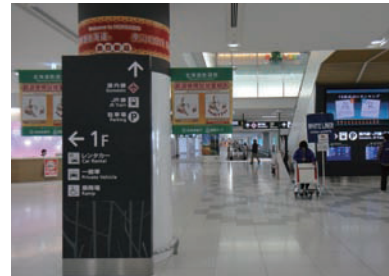
1 國際線航廈 2樓抵達大廳。