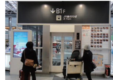
5 乘坐國內線航廈的電梯前往地下1樓。