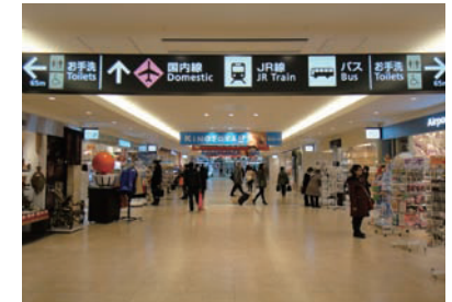
3 國內線航廈 一直往前走。