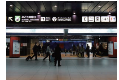
6 從地下1樓下電梯後向左走，可以看到JR外籍旅客服務處。