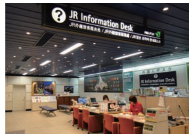
7 JR外籍旅客服務處 可兌換北海道鐵路周遊券、購買JR車票。