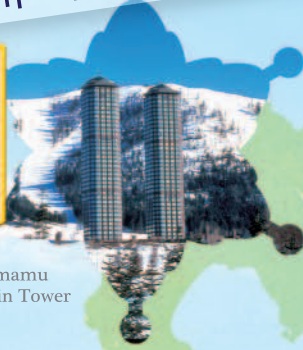
Tomamu Twin Tower