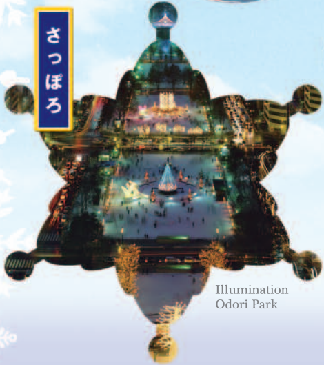
Illumination Odori Park